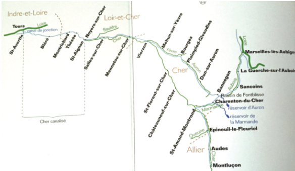
Tracé du canal de Berry et de ses trois branches. À partir de Bannegon et du bassin de Fontblisse, la branche nord rejoint la Loire à Marseilles-lès-Aubigny, la branche sud relie le Cher à Saint-Amand-Montrond et la branche ouest suit le tracé du Cher avant s'achever dans le Cher canalisé à Noyers-sur-Cher.