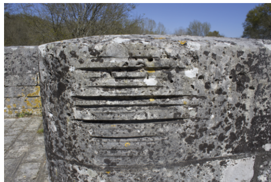
Marques de cordages sur le parapet du pont-canal de la Sauldre.

Malgré tout, devant la baisse inexorable du trafic, un déclassement du canal de Berry est envisagé au début des années 50. La branche Bannegon/Noyers-sur-Cher a le trafic le plus faible mais la branche de Montluçon connaît les problèmes d'alimentation en eau les plus importants. Finalement, le canal est déclassé par décret le 03 janvier 1955. Les ouvrages sont remis au service des Domaines. L'État vend le canal par tronçons pour un franc symbolique aux communes qu'il traverse. Beaucoup de communes décident alors de le combler. Mais dans les années 90, l'association ARECABE (Association pour la Réouverture du Canal de Berry) décide d'en rouvrir des tronçons pour les proposer à la navigation. La portion entre Langon-sur-Cher et Noyers est remise en eau à cette période.