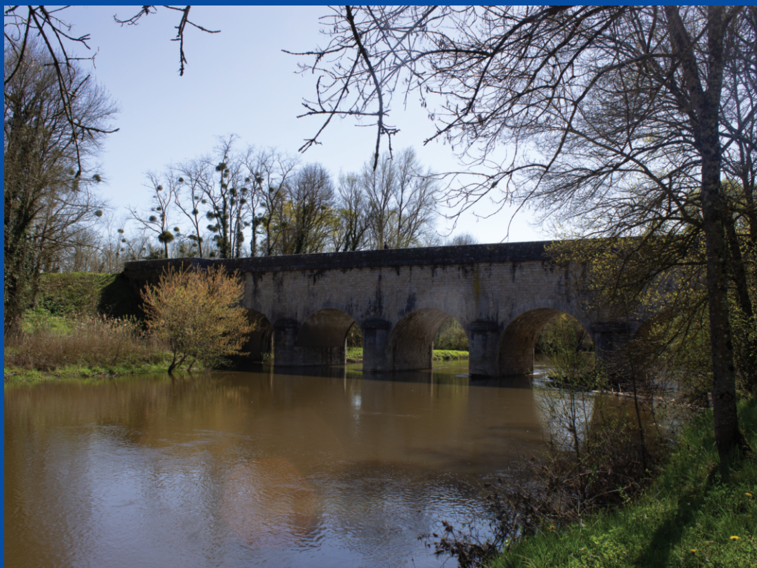
Pont-canal de la Sauldre, vue amont.

«Grâce à la qualité de ses mortiers, le pont-canal de la Sauldre est considéré comme l'ouvrage le plus étanche du canal de Berry.»