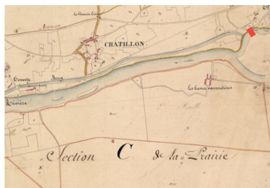
Extrait du cadastre ancien de Châtillon-sur-Cher (AD 41 3P2 43/1). Le canal de Berry est déjà représenté sur la partie ouest. En amont du futur pont-canal, un pont, disparu depuis, permettait de franchir la Sauldre.

Le pont-canal a été aménagé entre 1833, date de son premier projet, et 1839. Il a été conçu par l'ingénieur Camille Bailloud. En 1833, l'ingénieur propose deux projets : un pont-canal avec bache en fonte (deux arches de 16 mètres) ou un pont-canal en maçonnerie. C'est ce deuxième projet qui est retenu. Le pont-canal comprend cinq arches en plein-cintre de 7 mètres d'ouverture. En 1842, ce pont-canal est considéré par l'ingénieur Eugène Flachet comme l'ouvrage le plus étanche du canal de Berry grâce à la qualité des mortiers employés. D'après le cadastre napoléonien, il semble que le tracé du lit de la Sauldre ait été un peu modifié au moment des travaux.