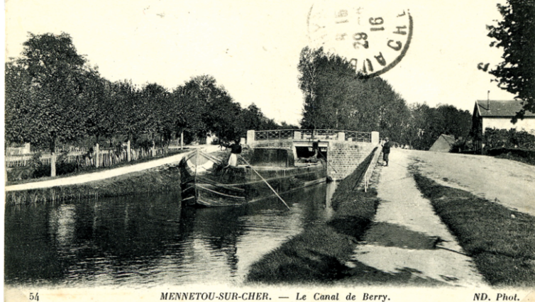
Péniche berrichonne franchissant l'écluse de Menetou-sur-Cher. Les dimensions très étroites du canal de Berry et de ses écluses ont conditionné la fabrication d'embarcations de transport spécifiques. Cette particularité s'est révélée être un handicap à long terme pour le développement de la navigation sur le canal.